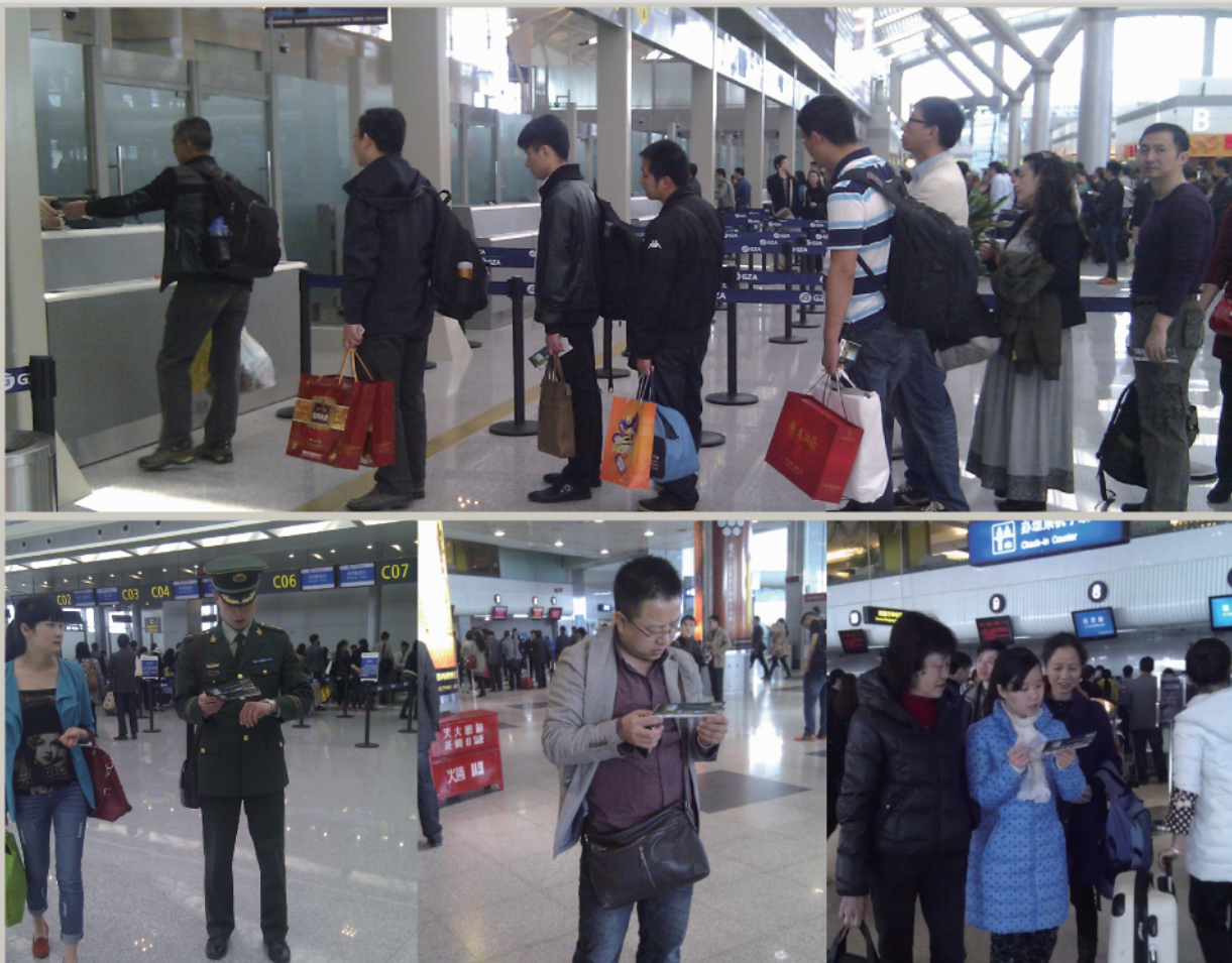
贵阳国际机场T1、T2航站楼投放 效果