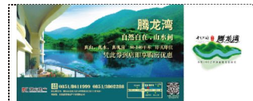
背面替换为您的广告内容